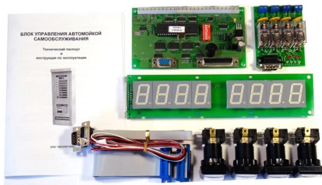
Набор для изготовления двойного торгового автомата до 2x3 программы