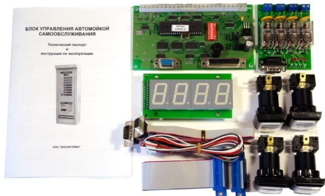
Набор для изготовления торгового автомата до 8 программ