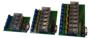
Плата управления ПУ-2х3